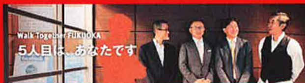
Walk Together FUKUOKA 5人目は、あなたです