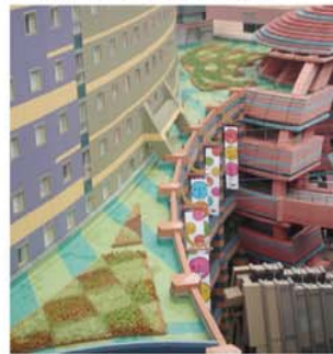
◎ワシントンホテル屋上緑化