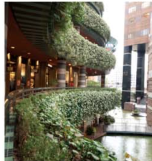
◎モール部分(壁面緑化)